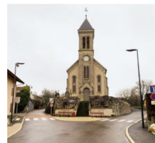
Commune de Saint-Gorgon - Aménagement de bourg