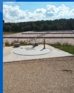
Travaux STEP – Darney

1 Bilan d'activité 2020 du 1 er octobre 2019 au 30 septembre 2020.