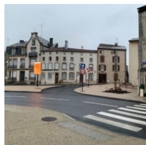
Ville de Rambervillers - Aménagement de la place du Fal