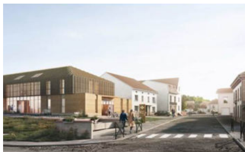
Commune d'ELOYES - Construction d'une maison de santé pluridisciplinaire et d'une pharmacie - Architecte mandataire du groupement MIL-LIEUX