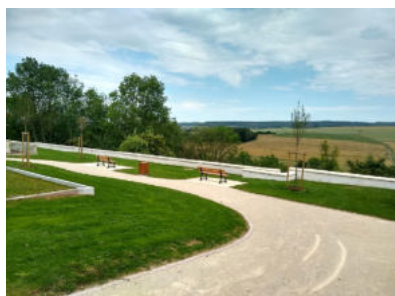
Commune de POUSSAY - Aménagement de cheminement piétons.